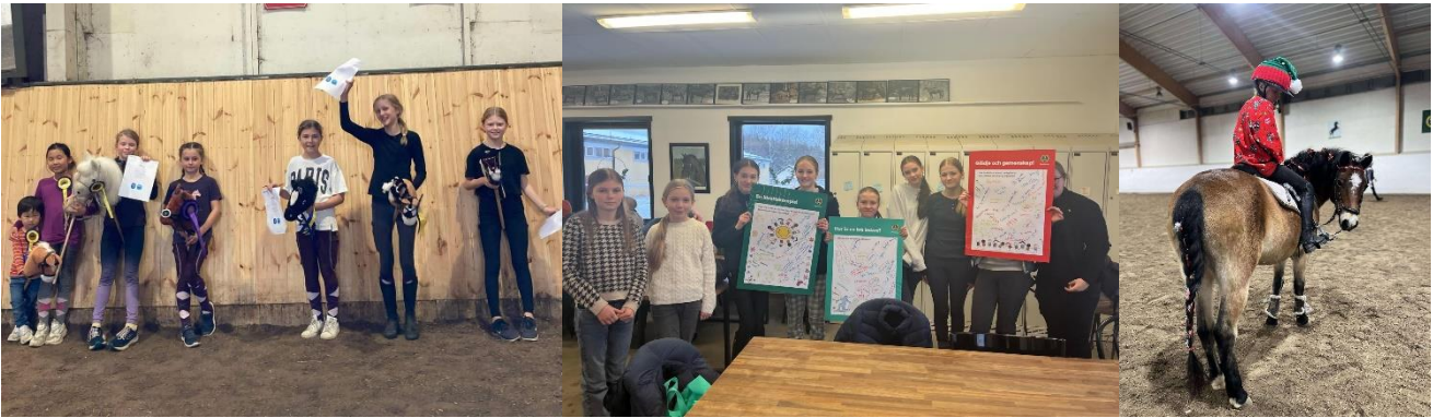
Från vänster: Glädjehoppet, värdegrundsaktivitet och tomtnisse i luciatåget.