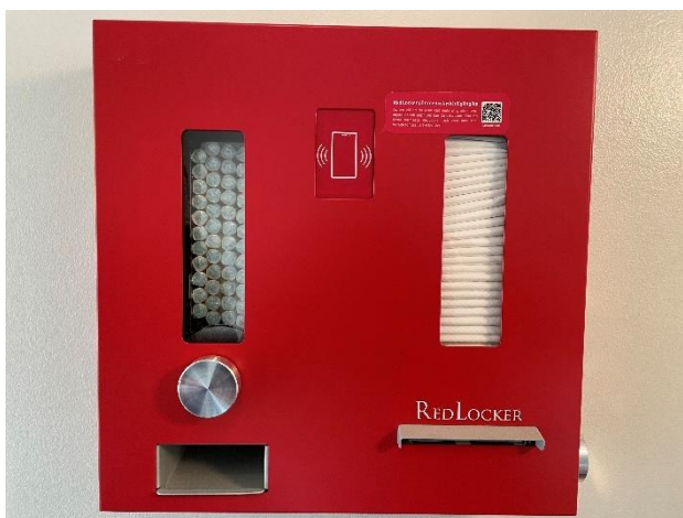
Från vänster till höger: Automatiskt tidtagarsystem, Mensskyddsautomat.

Ungdomssektionen (USEK) har en separat ekonomi och driver bland annat caféet.