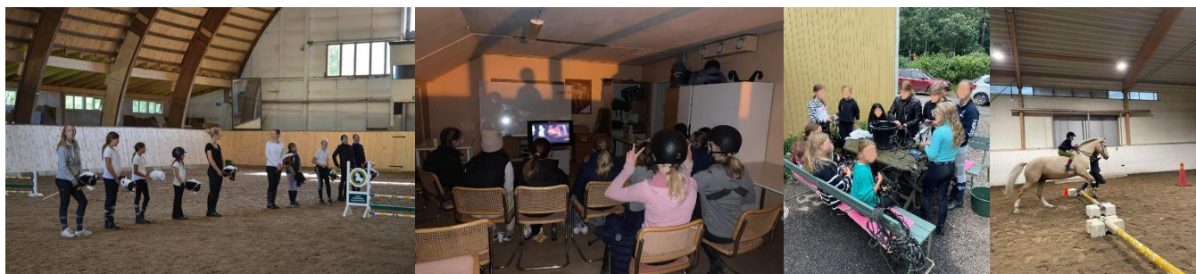
Från vänster till höger: Käpphästhoppningskadrilj under invigningsshowen, Filmkväll, Hästfixardag och Hurry Scurry.

USEK ansvarar för frågor som speciellt berör föreningens yngre medlemmar. Sektionen väljer själv sin styrelse och arbetar i enlighet med Svenska Ridsportförbundets instruktion för ungdomssektion. Verksamheten involverar både uppsatta och avsatta aktiviteter, ofta i samarbete med ridskolan.