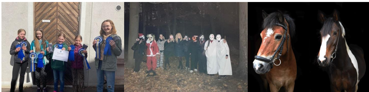
Från vänster: Det vinnande laget i Vi i Stallet , spökena i spökrundan och årets stallbästisar Ethel och Pepper.